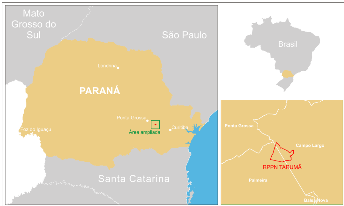
FIGURA 01-A – LOCALIZAÇÃO DA RPPN TARUMÃ